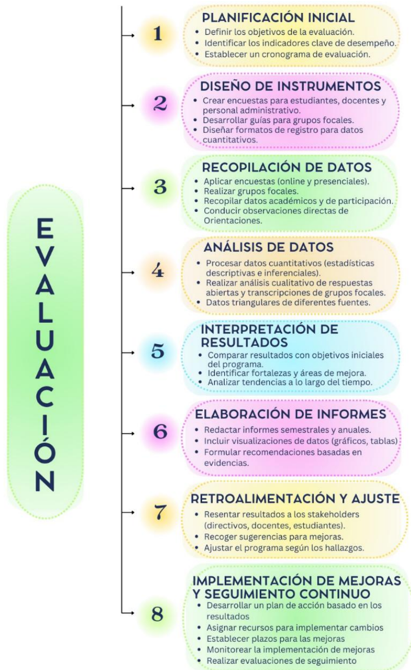
Figura. Síntesis de un modelo de evaluación de la aplicación del programa departamental por unidad académica